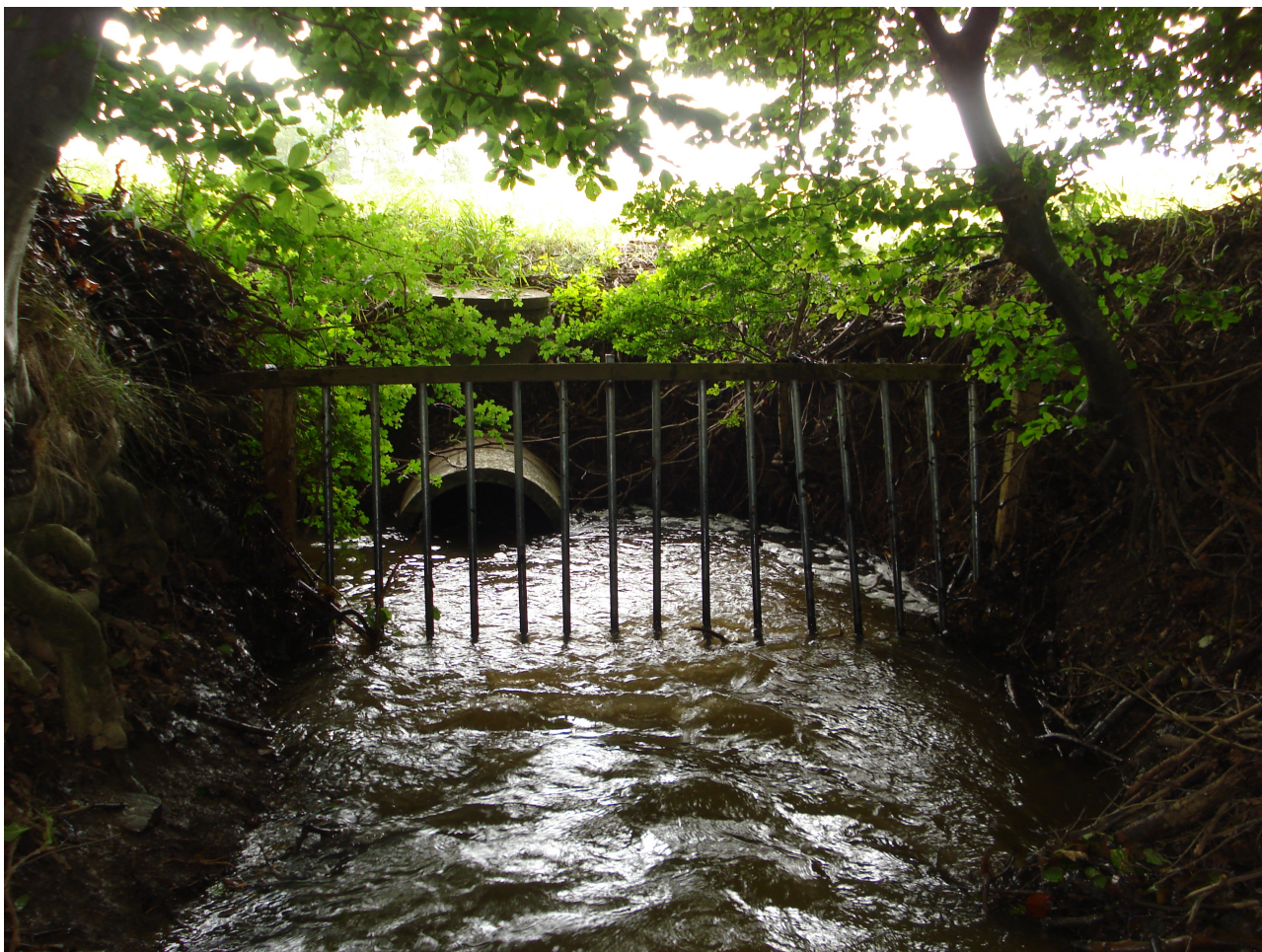
Tremmer set foran et rørindløb i Rydsbæk på Vestmøn